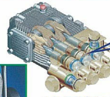
セラミック製3連プランジャポンプ