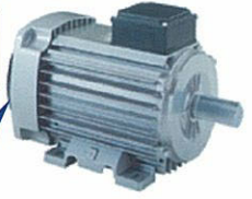
完全密閉絶縁級F4ポールモータ