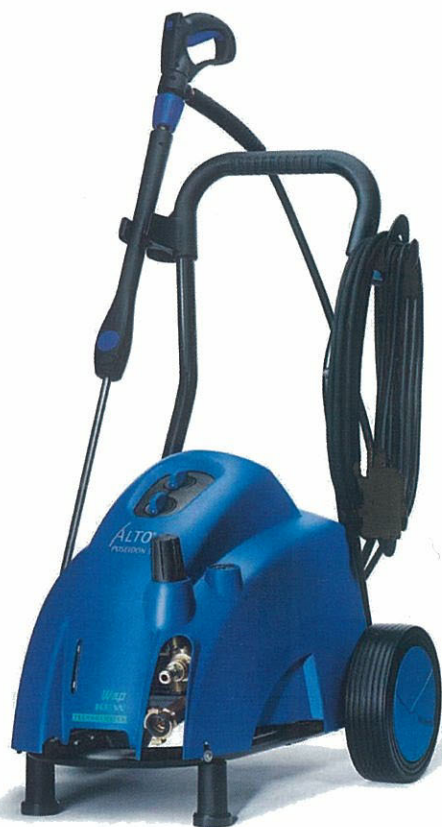
(写真はヨーロッパ仕様です。)